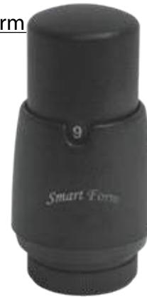
1703 Smart Form