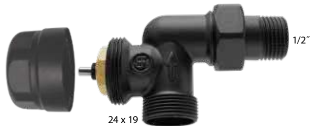
7008 Γωνία 24 x 19