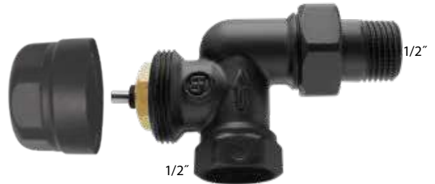
7009 Γωνία 1/2"