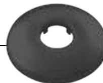
306 Ροζέτα Ανοξειδωτη Ø65

ΣΤΗΝ ΣΥΣΚΕΥΑΣΙΑ ΔΕΝ ΠΕΡΙΛΑΜΒΑΝΕΤΑΙ Η ΡΟΖΕΤΑ