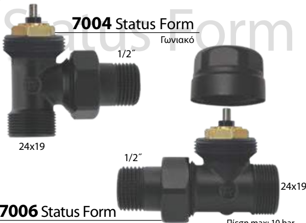
7004 Status Form