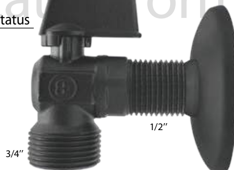
4015 Status Πλυντήριο