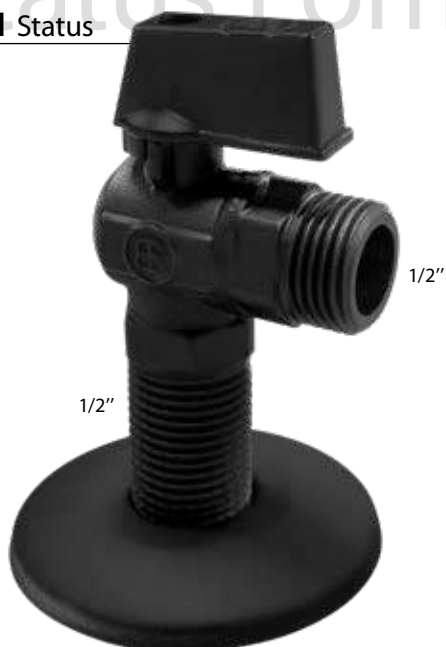
2011 Status Σπράλ